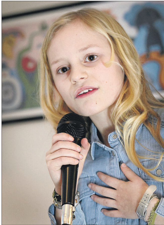
Det er med både sjæl og følelser, at sang-stjernen synger om, at alle skal behandles ordentligt. Hun ved, at der er opbakning fra sin nye klasse, som hun har fået billetter til showet til.

- Det er spændende og en god oplevelse for Flora. Der er meget konkurrence, så hun må ikke blive ked af det, hvis hun ikke vinder. DR har været rigtigt gode til at håndtere børnene og tage hånd om dem både før og efter showet. Forældre bliver plantet ved kaffeautomaten under audition, og så tager de sig af børnene. Det er en helt lille verden, hvor det hele handler om showet.